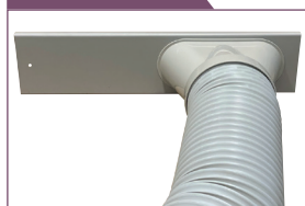
Kit fenêtre coulissante et sortie oblongue