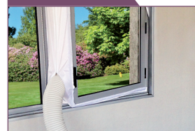
Kit fenêtre en option